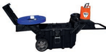
Family-12 - 450 €