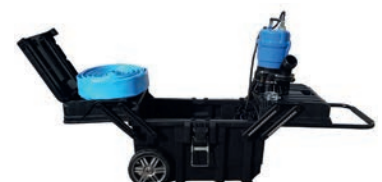
HS2 4S - 740 €