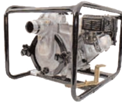
TED2 50 HA