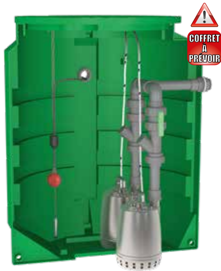
Volume de bâchée du poste (à régler sur site)

Poste livré avec 1 sonde piezo et 1 flotteur pour l'alarme trop-plein (10 m de câble).