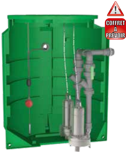
Volume de bâchée du poste (à régler sur site)

Poste livré avec 1 sonde piezo et 1 flotteur pour l'alarme trop-plein (10 m de câble).