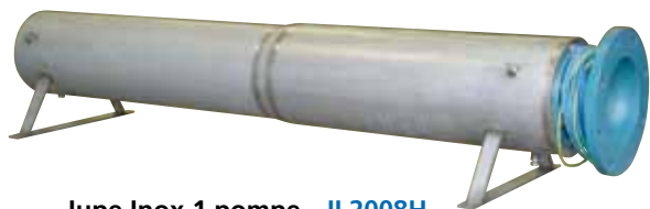
Jupe Inox 1 pompe - JI 2008H

Jupe de refroidissement inox pour pompes immergées utilisées en bassins, bêche de stockage, ... (hors forage).