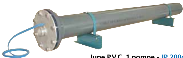
Jupe P.V.C. 1 pompe - JP 2004

Jupe de refroidissement PVC pour pompes immergées utilisées en bassins, bêche de stockage, ... (hors forage).