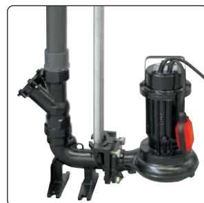
Exemple : CAL 230 - 75HMPA