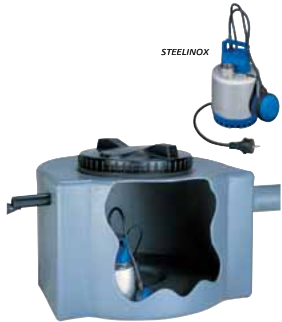
PRI 200 avec SXM 3