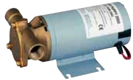
Pompe "basse tension" à impulseur flexible