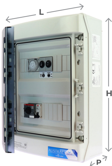
COFFRET F + PROJ.