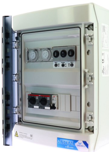
COFFRET F + BALAI + PROJ.

Dimensions (en mm) : 310 (L) x 435 (H) x 150 (P)