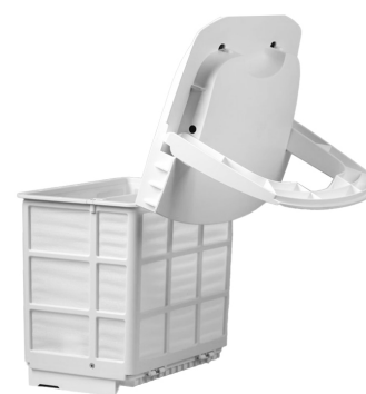
Panier amovible pour un nettoyage facile