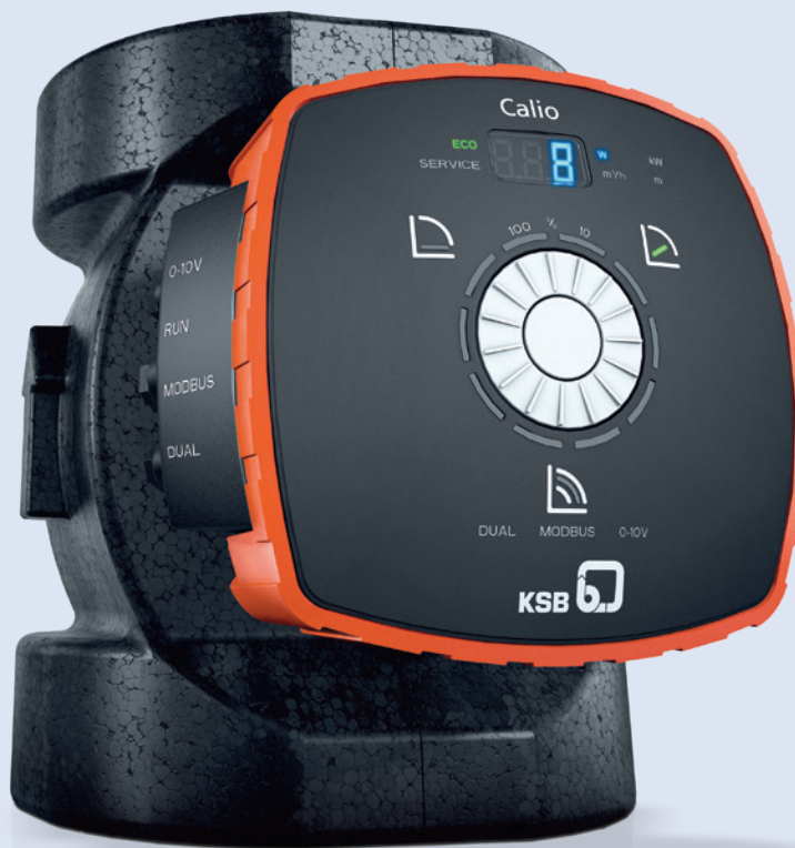
Calio avec coquille d'isolation thermique