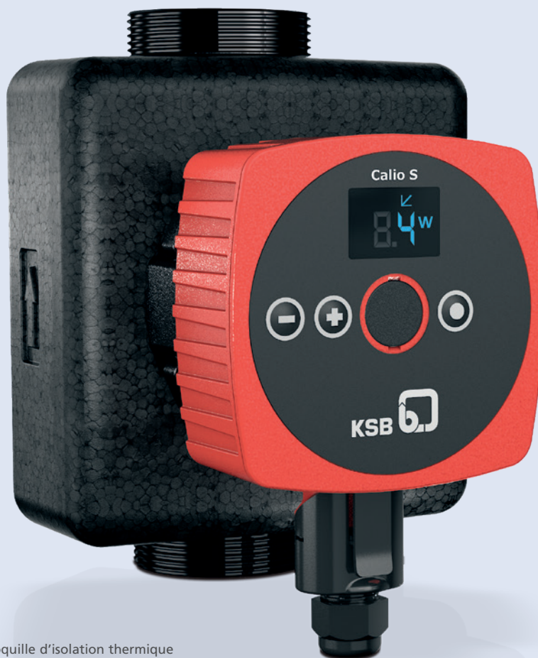
Calio S avec coquille d'isolation thermique