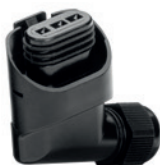
Connecteur mâle coudé