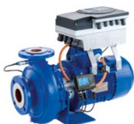
Etabloc avec PumpMeter, PumpDrive et moteur IE3