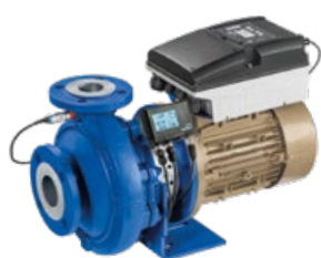
Etabloc avec moteur SuPremE® IE5 *KSB, PumpMeter et PumpDrive Eco

Etabloc avec moteur SuPremE® IE5* KSB, PumpMeter et PumpDrive