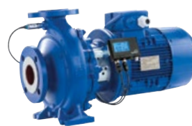
Etabloc avec PumpMeter et moteur IE3