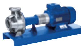
Etachrom L avec moteur IE3