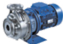
Etachrom B avec moteur IE3