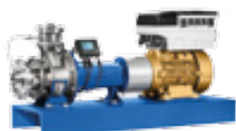
Etachrom L avec moteur SuPremE® IE5* PumpDrive et PumpMeter

Etachrom B avec le moteur SuPremE® IE5* de KSB, PumpDrive et PumpMeter