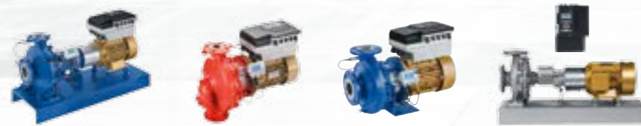
La nouvelle génération de la gamme Eta en exécution sobre avec le moteur IE4® SuPremE® de KSB et PumpDrive

La famille Eta compte 43 tailles différentes. Elle peut être équipée de moteurs à 2-, 4- ou 6-pôles. Le réseau hydraulique de la gamme a été densifié afin que les pompes soient sélectionnées au plus près de leur point de meilleur rendement. Enfin, chaque pompe est équipée d'une roue rognée jusqu'au point de rendement optimum. La polyvalence est notre standard.