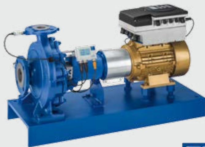
Etanorm avec le moteur KSB SuPremE, PrumpDrive et PumpMeter