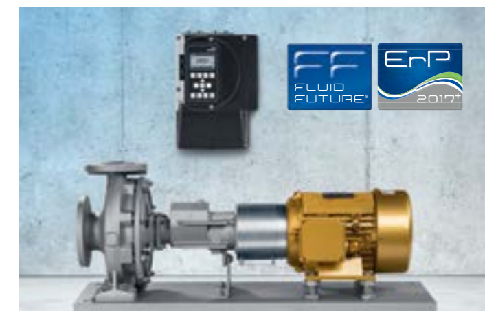
Etanorm SYT avec le moteur SuPremE® de KSB et le variateur PumpDrive en montage mural